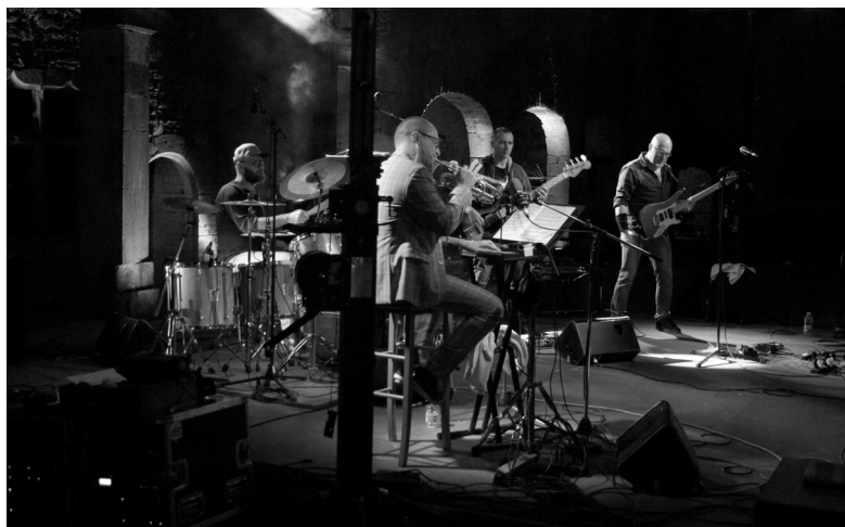
Wax'in Festival de jazz 2018