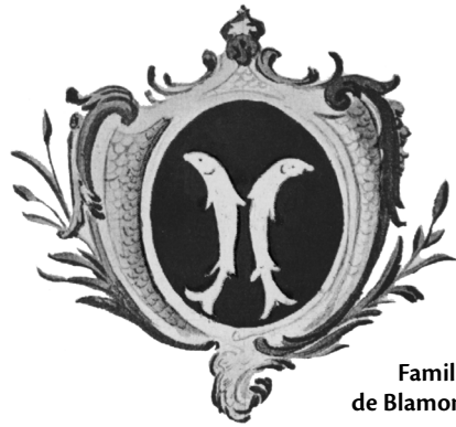
Famille de Blamont