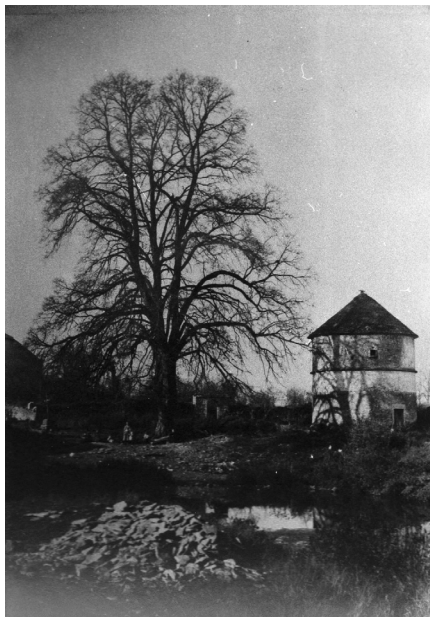
Le colombier, la mare et le tilleul au début du XX e siècle