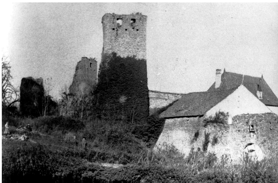
Entrée du château au début du XX e siècle