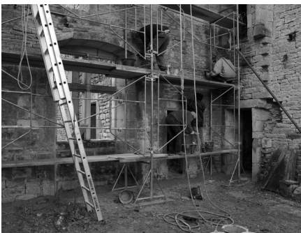
Logis Rolin : restauration du parement intérieur du mur de façade

L es premiers travaux permettront de consolider la façade sur l'entrée de la haute cour avec la reconstruction du contrefort. La porte d'accès sera alors rouverte et un escalier extérieur créé. À l'intérieur, les maçonneries seront confortées et les culots consolidés. La pose de la voûte et l'aménagement intérieur attendront l'année suivante.