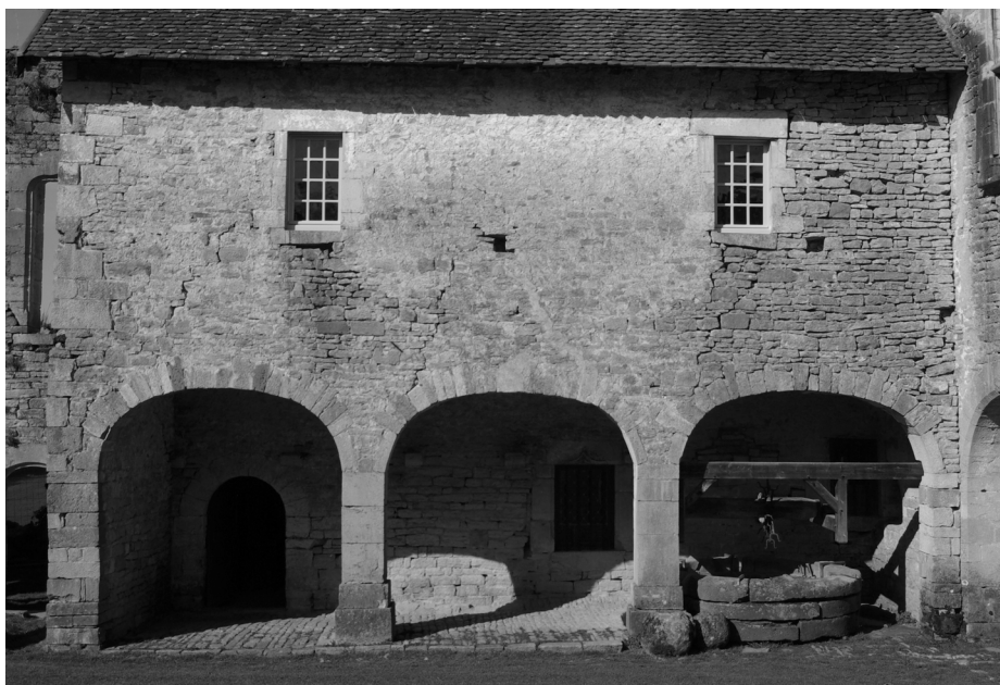
Galerie XVIII e : chassis de fenêtre posés en avril