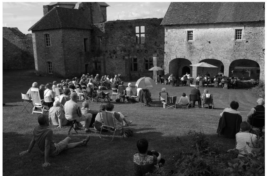
Concert du 7 mai

Le samedi 10 septembre 2016 : festival de jazz. A partir de 18h00, 7 groupes se succéderont sur deux scènes : Vesoul Jazz Orchestra, Kirchmeyer, SEBV, Cube Trio, Passage, Lucky People et Social Groove. Festival organisé par l’association “Bled’Arts”. Prix d’entrée sur place : 20€/15€ (15 €/10 € en prévente).