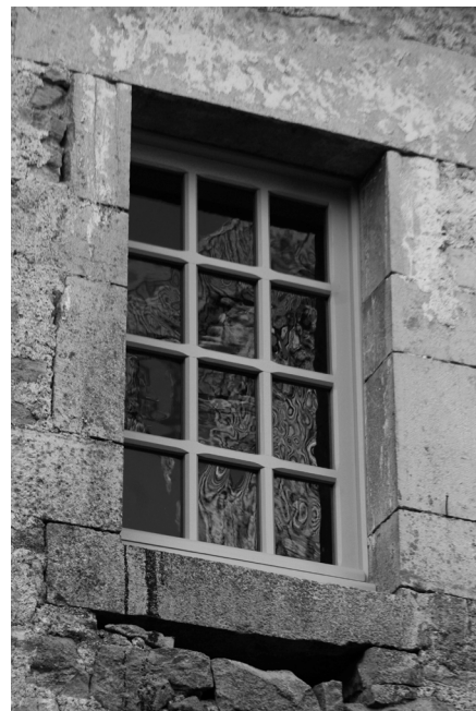
Galerie XVIII e : détail

de la courtine au droit de l'entrée de la haute cour, restauration des parements de la "viorbe" et pose de menuiseries dans cette tourelle et sur la galerie – voir journal n° 26). L'ensemble de ces travaux, pour un montant total de 24 861,79 €, a été financé à 50% par l'État au titre de l'entretien sur MH classé. Les fournitures nécessaires à la confection des menuiseries et vitreries, s'élevant à 5 523,79 € TTC, ont été prises en charge par la SHAARL (Société d'Histoire et d'Archéologie de l'Arrondissement de