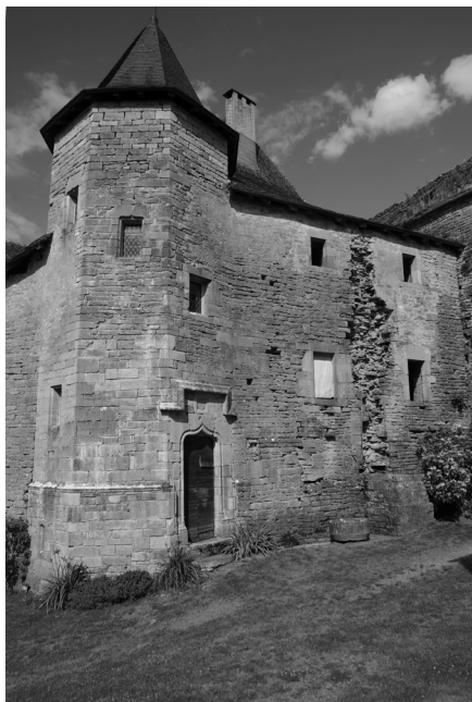
Façade de la chapelle avant restauration