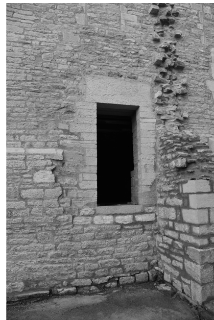
Porte d'entrée restaurée

Les travaux de confortement des maçonneries extérieures sont terminés (ouverture de la porte d'entrée, consolidation du contrefort et des baies et jointoiement de l'ensemble de la façade). La couverture a été révisée.