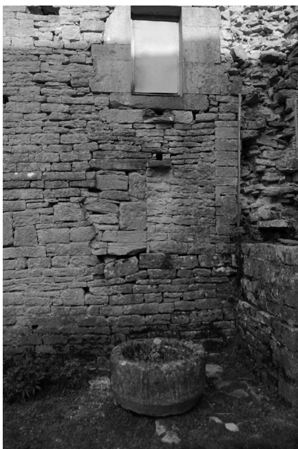
Porte d'entrée murée au XVIII e siècle

Ce numéro 33 est réduit à une seule page et publié avec beaucoup de retard. Veuillez nous en excuser. Les travaux de restauration de la chapelle vont bon train et devraient être terminés vers le milieu de l'automne. La fin de l'année sera l'occasion de réaliser un numéro spécial sur cette belle réhabilitation avec de nombreuses photographies.