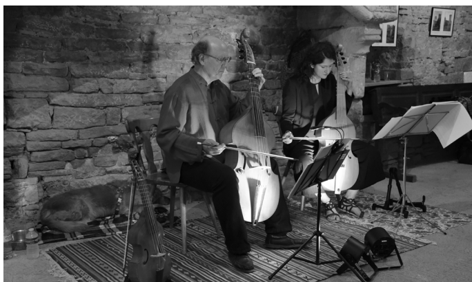
Concert de viole de gambe