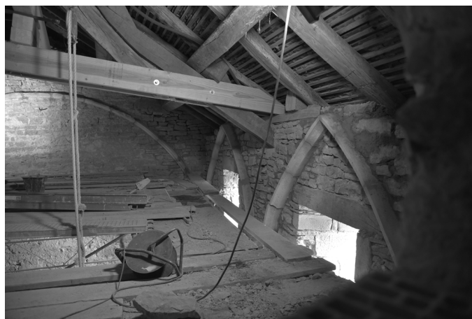
Transformation de la charpente et restitution des arcs formerets