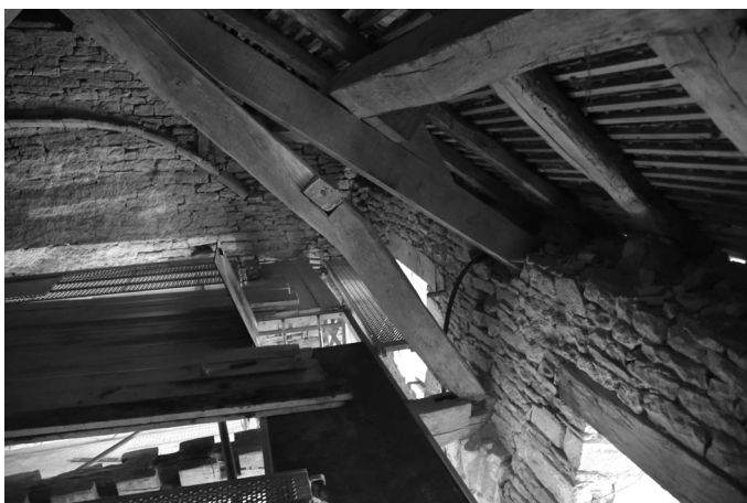
Charpente avant travaux