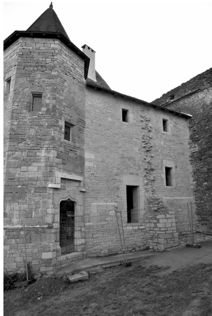
Façade de la chapelle, juillet 2019

À l'intérieur, la charpente a été transformée pour libérer l'espace nécessaire à la restitution de la voûte à croisée d'ogives. Les pieds de gerbe sont consolidés et les arcs formerets complétés pour soutenir le nouveau couvrement. Les enduits intérieurs seront réalisés dans l'été. Les différentes menuiseries, portes et fenêtres, sont en cours d'élaboration dans l'atelier du château. Le charpentier s'affaire à l'usinage des structures de la voûte qui sera mise en place en octobre. Il ne resta plus qu'à poser les carreaux de terre cuite au sol et à badigeonner l'ensemble des parlements intérieurs.