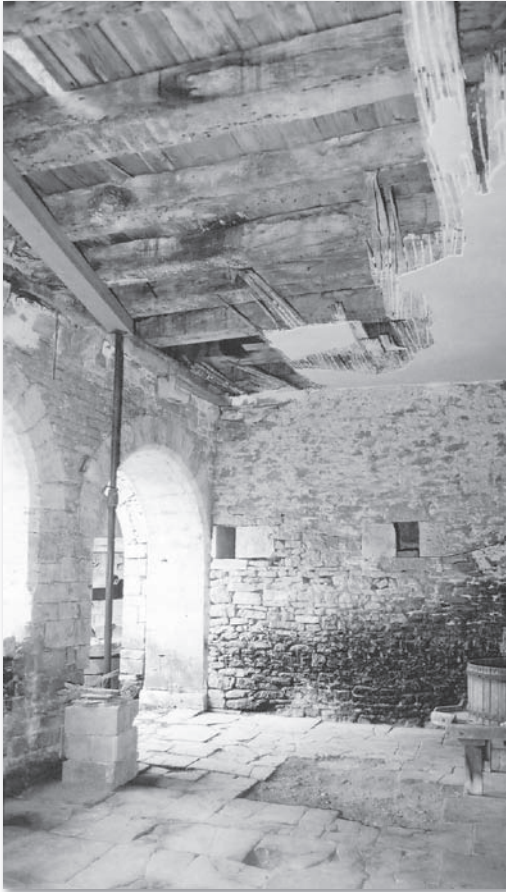
Galerie XV e siècle - avant les travaux

D'autres travaux ont pu être effectués cette année et en particulier la restauration du mur d'enceinte de la haute cour pendant le chantier d'été. Le toit de l'édicule de la basse cour est terminé. Une charpente a été créée d'après une ancienne photographie, retrouvée dans les archives de la SHAARL. Elle a été mise en place au cours d'un chantier dominical et la couverture de tuiles plates achevée à la fin de l'été. Ce local abrite maintenant la chaufferie. Lors d'autres chantiers associatifs, un nettoyage du talus nord a permis de mettre à jour les restes d'un moineau *, de stocker de la pierre pour de futurs travaux et de préparer la restauration d'une autre partie de l'enceinte de la haute cour.