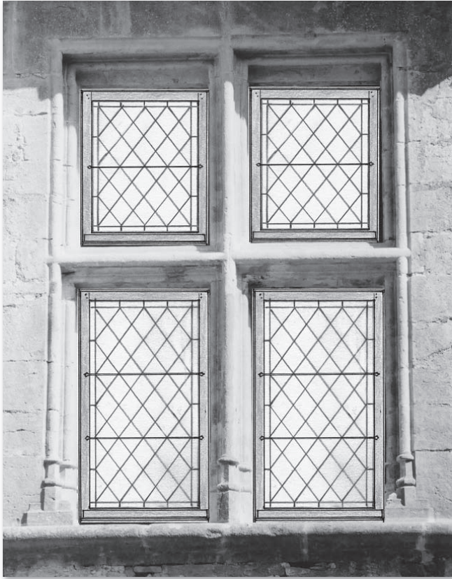
Projet de menuiseries pour les trois fenêtres à meneaux de la galerie XV e siècle