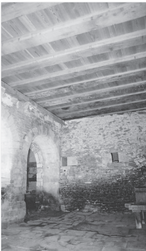
Galerie XV e siècle - après les travaux