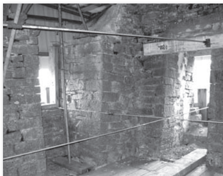
Sommet actuel de la tour (intérieur)

Cela fait plus de 40 ans que je fréquente Oricourt, et j'ai connu la plus haute tour (qui n'est pas le donjon) sans aucun bardage. Alors je fais un rêve, et faites-le avec moi. Un jour, des mécènes ou des sponsors se présenteront et offriront le financement des travaux de restauration de cette tour avec notre participation en fonction de nos moyens, de l'État, de la Région et du Département.