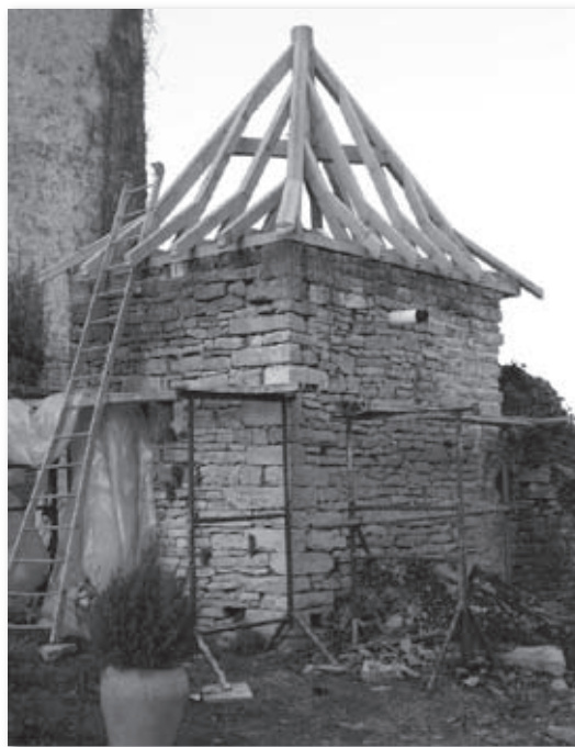
Travaux de charpente dans la basse-cour

Au mois d'août, a été effectuée la mise en place des menuiseries d'une des fenêtres Est du château (G sur le plan). Les pierres sont celles qui ont été visibles tout le début d'année à l'entrée du château, ainsi qu'au stand de taille de pierre des dernières journées médiévales. Il a aussi été conçu et fabriqué la menuiserie, quatre vantaux et volets intérieurs, de la baie. Ils sont aujourd'hui en place.