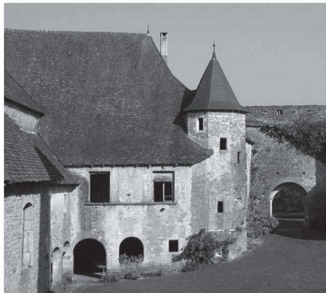
La galerie aujourd'hui