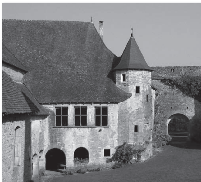
La galerie après travaux (montage photo)