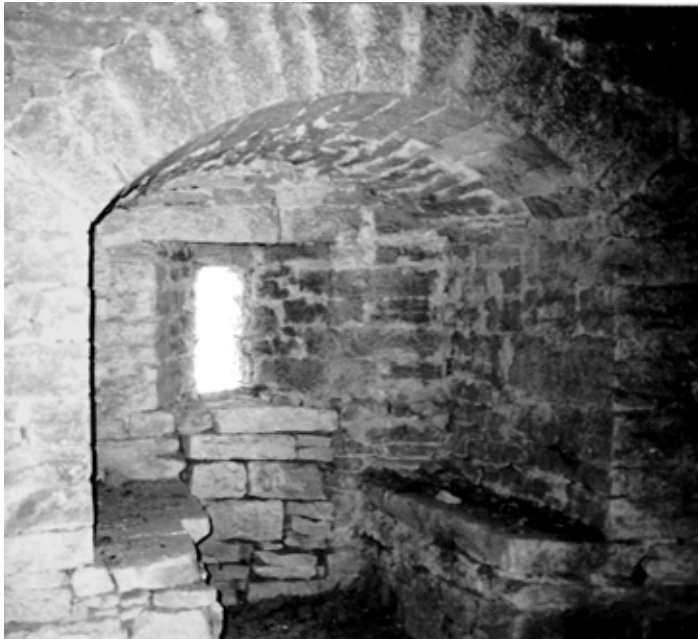
Détail d'une des meurtrières de la salle des gardes de la haute tour ceinturée. XIIème siècle. L'épaisseur du mur atteint 2,50 m.

L'issue de l'assemblée générale, autour d'un casse-croûte amical et sympathique, laisse bien augurer des prochaines journées médiévales comme de l'avenir de notre association. Persévérons tous ensemble et chacun à sa façon, selon sa disponibilité, pour que vive le château d'Oricourt que nous aimons à défendre !