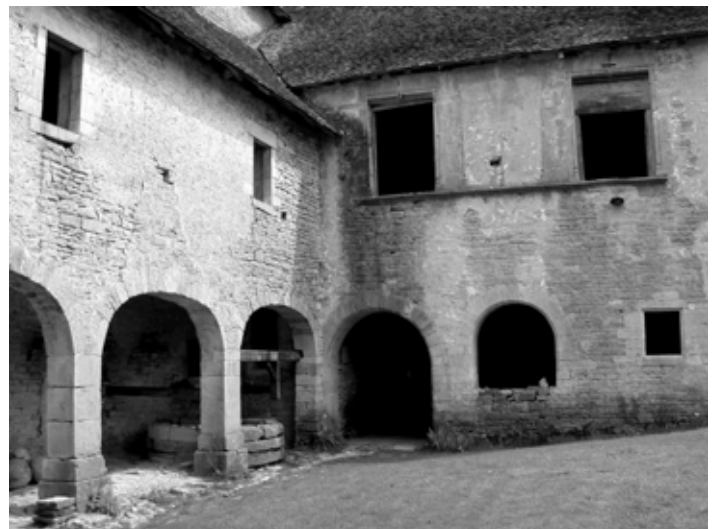
Galleries de la Haute-cour et puits.